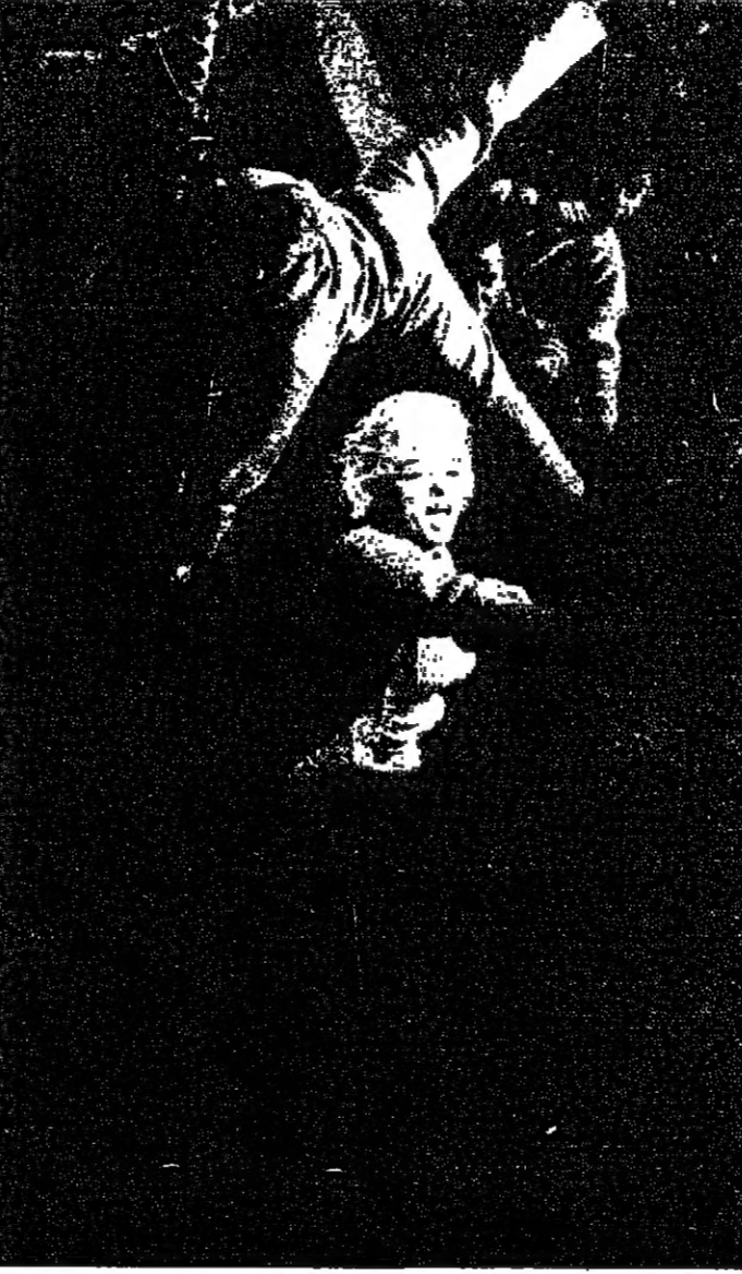
مارلين مونرو: حركة المرأة الخالدة في روضة الحظوة ... الصاعقة